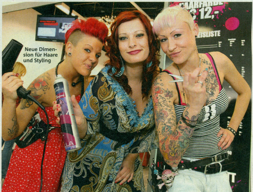
Neue Dimension für Haare und Styling

Im Hobbyraum eines Kaisermühlner Gemeindebaus wird derzeit fleißig trainiert: Die „Musical Kids Company“ will das Publikum mit Hits aus bekannten Stücken begeistern. S. 38