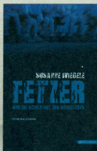
ISBN 978-3-902672-83-4 | € 19,90

Erschienen im echomedia buchverlag. Erhältlich in Ihrer Buchhandlung, im Online-Buchhandel oder direkt unter www.echomedia-buch.at